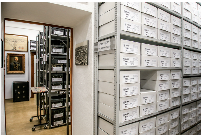
Blicke in die alten, aber sicherheitstechnisch nachgerüsteten Archivmagazine

Nach Fertigstellung und Einrichtung der Archivräume verfügt das Stadtarchiv nun über Magazinräume, die dem modernen Stand der Technik und archivischen Ansprüchen genügen. Insgesamt betrachtet hat sich das Stadtarchiv Olpe im Laufe der letzten Jahrzehnte – von Politik und Verwaltung gefördert – zu einer kompetenten