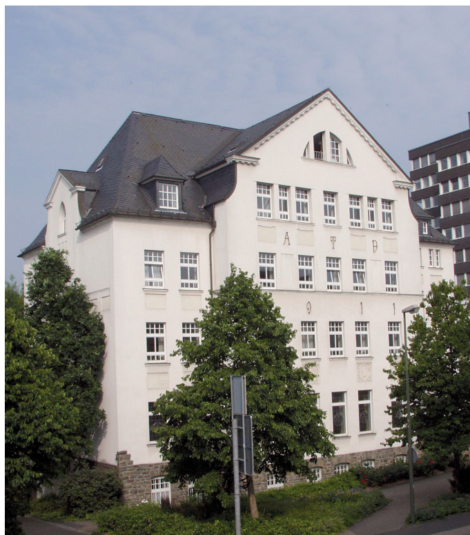
Das Alte Lyzeum in Olpe beherbergt seit 1991 auch das Stadtarchiv Olpe.

Nachdem es zu Beginn des Jahres 2015 zu Einbrüchen durch die Kellertür des Alten Lyzeums und auch zu Vandalismus, ja sogar zu einem Einbruchversuch in die Archivräume im Dachgeschoss gekommen war, wurde das Thema „Sicherheit des Stadtarchivs“ von der Politik erneut aufgegriffen. Nun ging alles ganz schnell, zumal man sich auch darin einig war, das Stadtarchiv unabhängig von der Rathausfrage an seinem