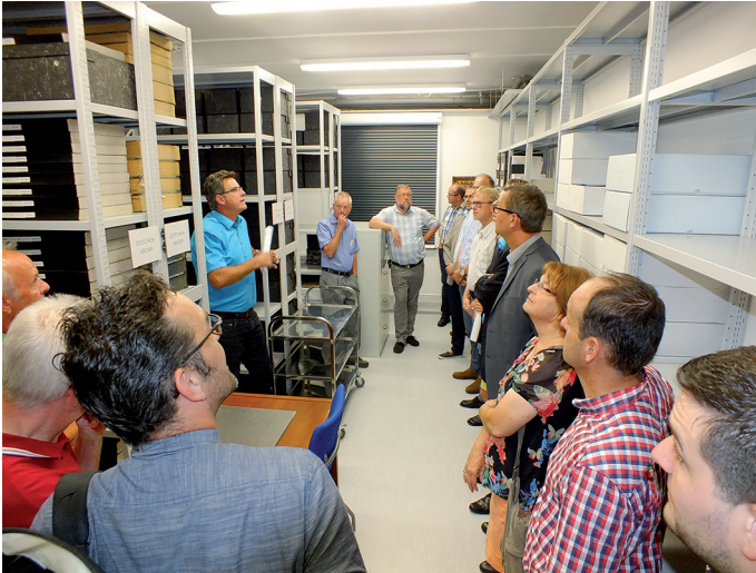
Der Ausschuss Bildung, Soziales, Sport besichtigt die neuen und die sicherheitstechnisch nachgerüsteten Archivmagazine im Alten Lyzeum am 7. September 2016.

gesamten Gebäude mit direkter Aufschaltung zur Feuerwehr sowie einer Einbruchmeldeanlage in sämtlichen Archivräumen im Keller elektrotechnisch abgesichert werden. Weiterhin wurde beschlossen, die Archivräume mit einem neuen, wischbaren Boden, einer optimalen Beleuchtung und die bisher schon vergitterten Fenster zusätzlich mit Innen-Rollos auszustatten, um das Archivgut vor direkter Sonneneinstrahlung zu schützen.