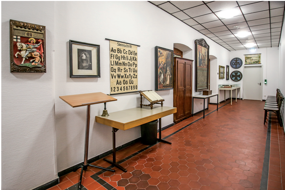
Der Flur des Archivmagazins des Stadtarchivs Olpe