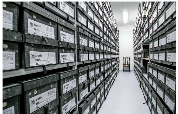
Blicke in die neuen Archivmagazine des Stadtarchivs Olpe